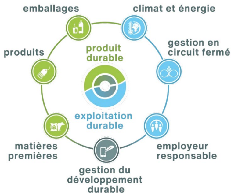
Illustration : Domaines cibles de la stratégie de durabilité pour le groupe Micarna et donc aussi pour Mérat.

Le domaine cible de la gestion de la durabilité comprend le traitement systématique de la durabilité. Le système de gestion de la durabilité est certifié selon la norme ISO 14001. Quatre sites de Mérat (Berne, Rothenburg, Landquart et Martigny) sont certifiés ISO 14001 depuis 2020 ou 2021. Deux sites ont été certifiés en 2022 (Allschwil et Zurich) et la certification du dernier site de Mérat à Sigirino est en préparation.