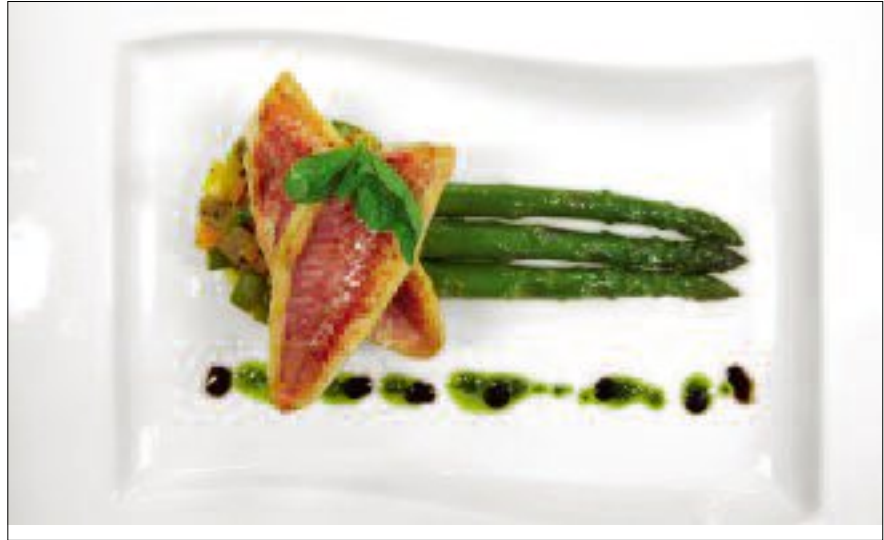
Beispiel 1. Gebratene Wildfang-Meerbarbenfilets auf Spargelratatouille und grünen Spargelspitzen sowie Bärlauchöl.

Er nennt noch mehr Vorteile: Die Fische würden vor Ort, oft noch auf dem Fangschiff, auf einem sehr hohen Standard eingefroren. Weiter könnten tiefgekühlte Produkte saisonale Lieferengpässe überbrücken, beispielsweise an Ostern. Oder wenn wie vor kurzem