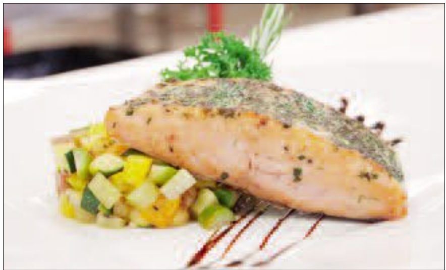
Beispiel 2. Im Ofen gegartes Wildlachsfilet (MSC = aus nachhaltiger Fischerei) im Kräutermantel mit mediterranem Couscous.